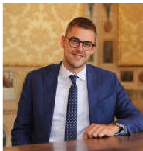
Giacomo Gambi Cultura e Politiche Giovanili