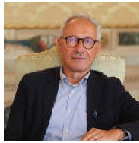
Michele Zanelli Urbanistica