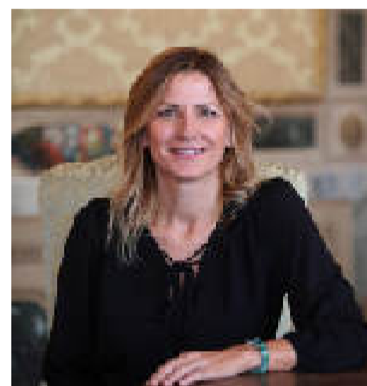
Elena Penazzi Autodromo, Turismo e Servizi al Cittadino